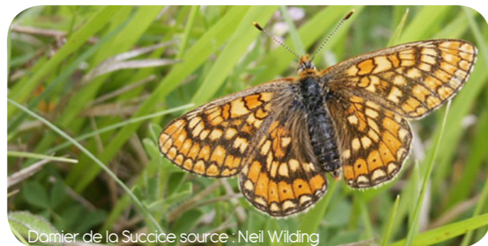
Damier de la Succise

Pour préserver le patrimoine naturel de la Vallée de la Renaudie en conciliation avec les activités humaines, le CREN Poitou-Charentes a tissé des partenariats avec plusieurs agriculteurs locaux. Des surfaces en prairies sont ainsi confiées aux exploitants sous réserve que ceux-ci respectent un cahier des charges environnemental (absence de fertilisants et pesticides, fauche tardive...). Ces agriculteurs peuvent également s'engager dans des Mesures Agro-Environnementales propres au site Natura 2000 de la vallée de la Tardoire. Ces contrats leur permettent d'être indemnisés pour leurs actions en faveur de la biodiversité.