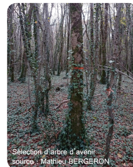
Sélection d'arbre d'avenir