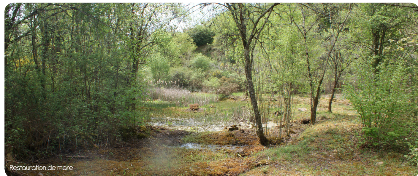
Restauration de mare

Ces travaux ont favorisé la restauration et l'entretien d'habitats d'intérêt communautaire et des espèces qui y sont associés. Un nouveau contrat Natura 2000 devrait être signé dès 2015 pour pérenniser ces actions.