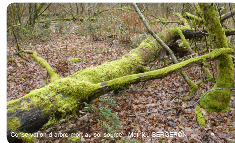
Conservation d'arbre mort au sol